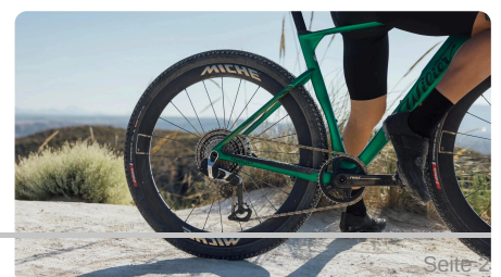
MICHE GRAFF AERO 48 CARBON